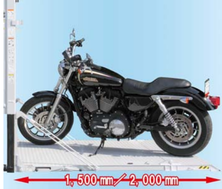
大型バイク積載例

プラットホーム長を1,500mm(積載能力600kg)と2,000mm(積載能力450kg・二枚折れ仕様)の2種類設定しました。標準プラットホーム(※)の1.7~2.3倍の長さで、全長の長い大型バイクなどを積載することも可能です。 (※V600プレスゲート:870mm)