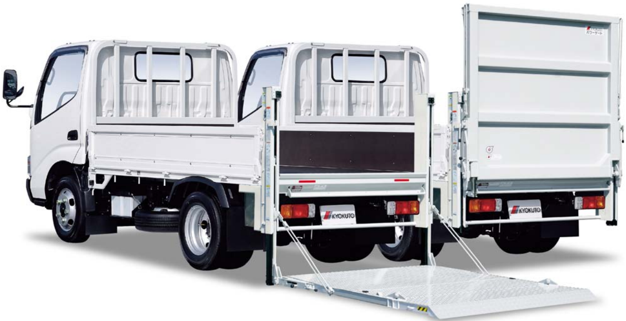
「パワーゲート V600 長尺ゲート」

極東開発グループでは、製品ラインナップの強化に努め、お客様の多様なニーズにお応えします。