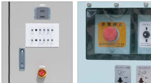
緊急停止スイッチ

ポンプユニットとパワーユニットそれぞれに配置した緊急停止スイッチや状態表示ランプおよび操作スイッチの配置など、作業者の安全性と使い勝手にも配慮した設計になっています。