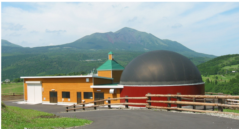
バイオガスプラント (コーンズ社納入・宮崎県 高千穂牧場)

極東開発グループでは、今後とも環境事業を通じて循環型社会の形成を目指してまいります。