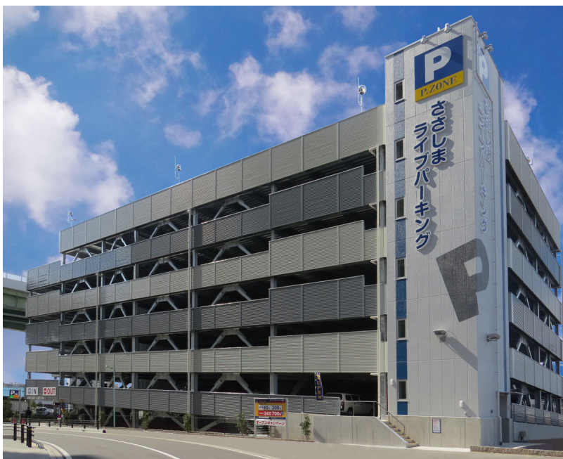
P.ZONE ささしまライブパーキング

極東開発グループでは、今後ともパーキング事業を通じて、暮らしやすい街づくりを地域と共に推進してまいります。