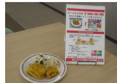
TABLE FOR TWOプログラム