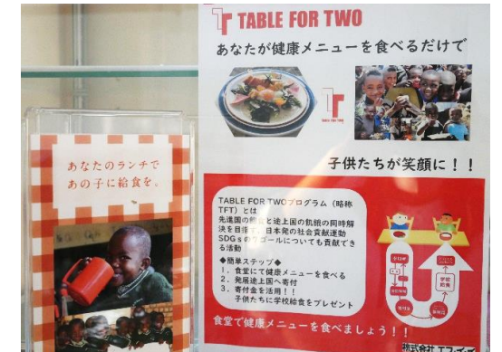
TABLE FOR TWOプログラム