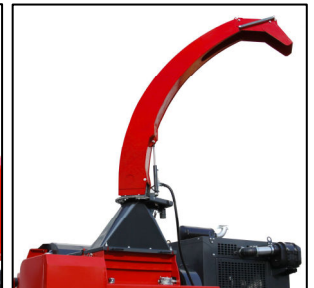
排出ブローアから チップを排出