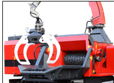
クレーン・木材供給装置により 原料を破砕機へ搬送