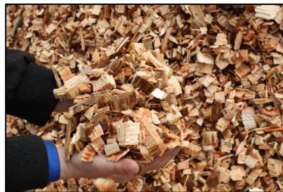
高品質なスライスチップ

木質バイオマス発電所での木材チップのコンベアでの搬送や、発電燃料としての燃焼効率の観点から、発電所での使用に適した高品質なスライスチップを製造することができます。