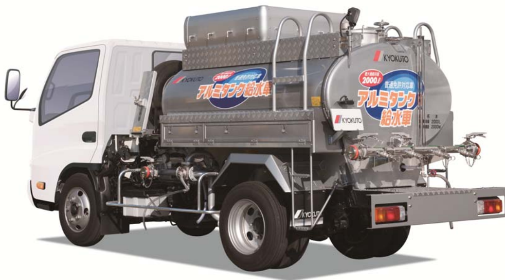
「アルミタンク給水車」

極東開発グループでは、新機種の投入により製品ラインナップを拡充し、特装車事業の強化を図ってまいります。