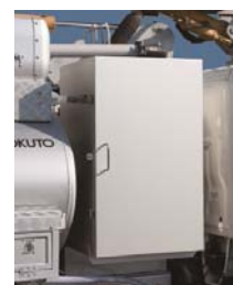
キャブバック大型 ツールボックス