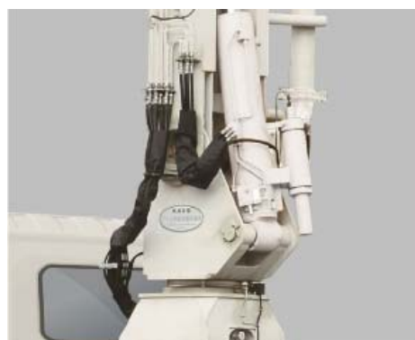
制振装置 (KAVS II)

ブームに掛かる荷重をサスペンション機能により軽減し、揺れを抑える当社が開発した世界初で独自の制振装置(KAVS® II)を搭載しています。これにより耐久性の向上とオペレータの負担が軽減し、作業環境が向上します。