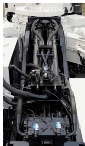
高圧大容量ポンプユニット

国内最大となる16.0MPa(8B仕様・高圧圧送時)の最大吐出圧と、135 m 3 /h(9B仕様・標準圧送時)の最大吐出量を誇り、さらにポンプの緻密な電子制御による大幅な低騒音性を兼ね備えた高圧大容量ポンプユニットを搭載しています。使用頻度の高い中間作業能力域(吐出量:50~80 m 3 /h)での吐出圧も大幅にアップさせているため、様々な現場に対応でき、作業時間や工数も削減されます。