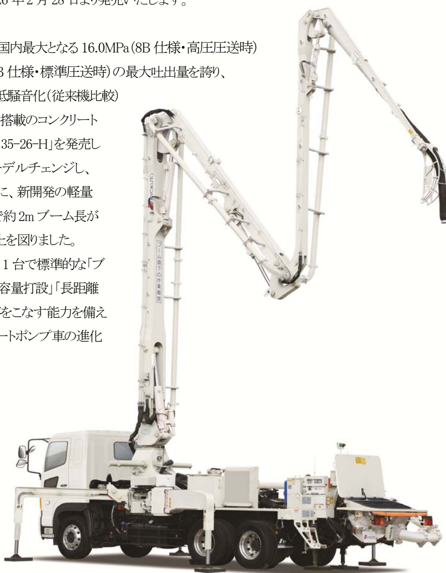
「ピストンクリート PY135-28-H」

極東開発グループでは、新機種の投入により製品ラインナップを拡充し、特装車事業の強化を図ってまいります。