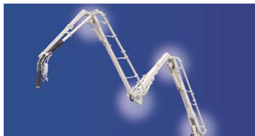
軽量28m級M型4段屈折ブーム

新開発の高張力鋼を使用した軽量28m級M型4段屈折ブームを、ホイールベース約5,550mmの自動車排出ガス規制(ポスト新長期規制)に対応したGVW22トン車に搭載することで、あらゆる現場に対応できる機動性を確保しました。