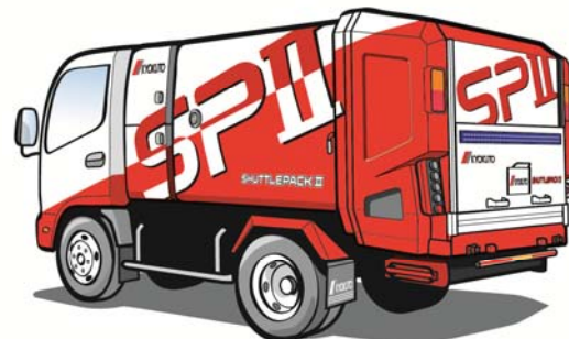
普通免許対応 新機構ごみ収集車 「シャトルパック II」