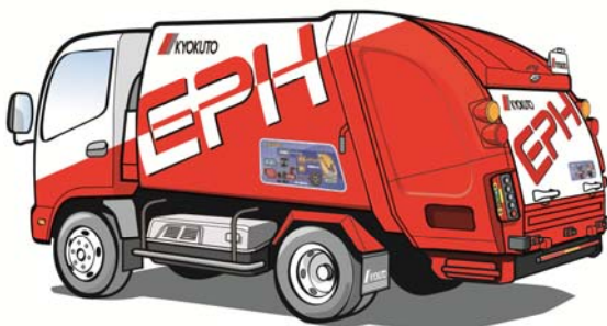
2トンプレス式 電動式塵芥収集車 「eパッカー ハイブリッド」