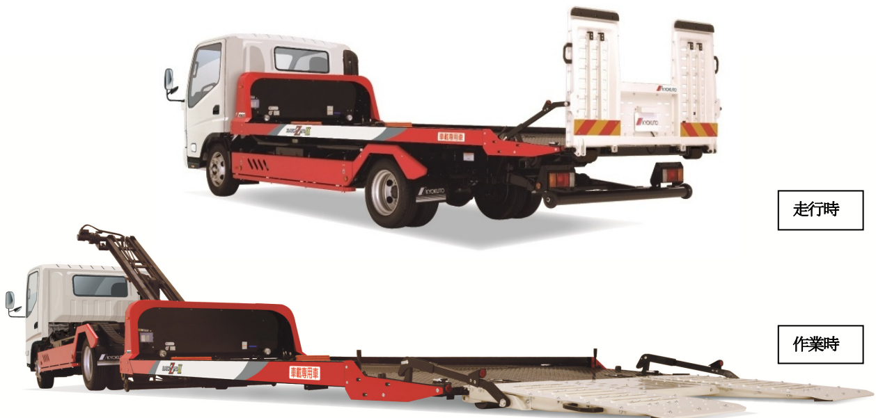
「フラトップ Zero II (2t 車載専用車)」

極東開発グループでは、今後も製品ラインナップの強化に努め、お客様の多様なニーズにお応えします。