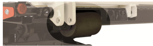
ボデー後端樹脂ローラ