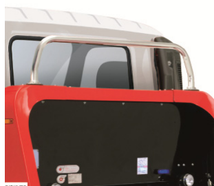
フロントアーチプロテクタ

フロントアーチには作業灯やミラー等の追加装着も可能なプロテクタを、また車両サイドには開閉可能なサイドスクートをそれぞれオプション設定しました。スタイリッシュさと機能がより一層アップする新しい装備です。