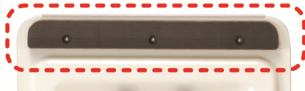
テールゲート先端 クッションゴム