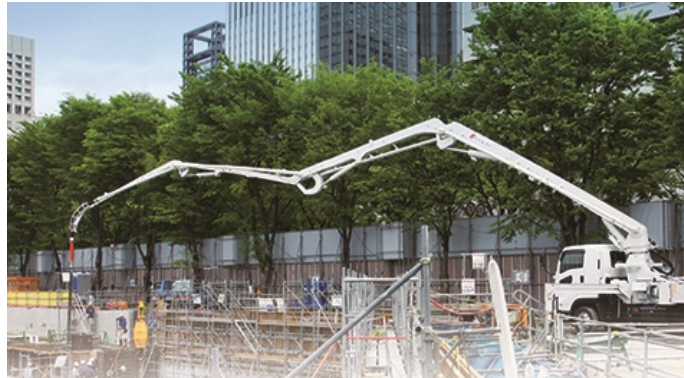
33メートル級M型4段屈折ブーム

高い機動力とクラス国内最長のブームにより、あらゆる現場で効率的な作業に貢献するオールマイティーなピストン式コンクリートポンプ車です。