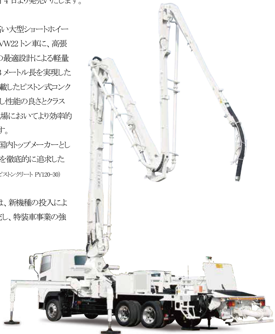
「ピストンクリート PY120-33C」

極東開発グループでは、新機種の投入により製品ラインナップを拡充し、特装車事業の強化を図ってまいります。