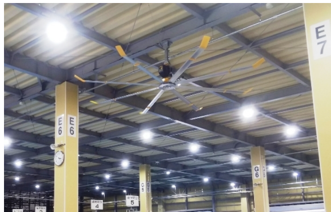
天井サーキュレーション