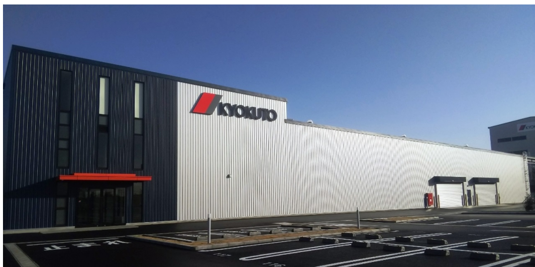
新パワーゲートセンター全景

極東開発グループでは、今回の新パワーゲートセンターの竣工により、主力製品のひとつであるパワーゲートの品質および製品力のさらなる向上とシェアアップを目指し、業績の拡大に一丸となって努めてまいります。