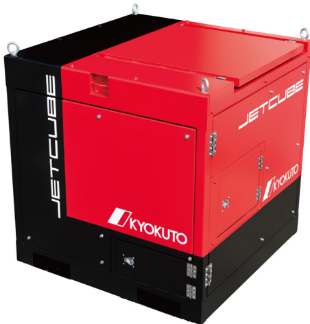
木質ペレットエア搬送ユニット 「JETCUBE (ジェットキューブ)」