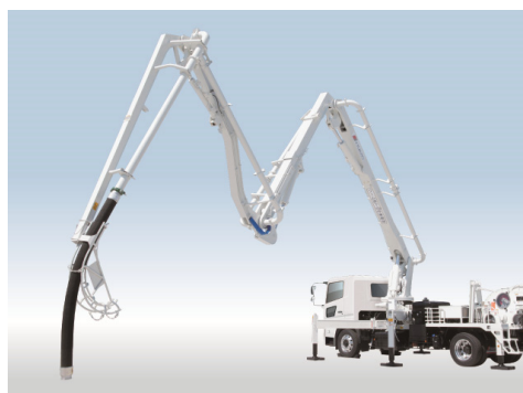
26メートル級M型4段屈折ブーム

ロングブームのニーズにお応えして、スクイズ式で国内最長となる26m級M型4段屈折ブームを搭載しました。国内トップシェアの当社だから実現した1台です。