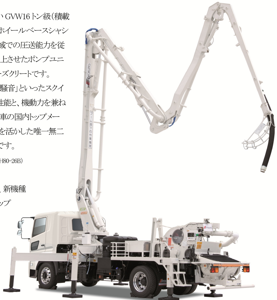
「 “ Hyper CP ” スクイーズクリート PH80A-26C」