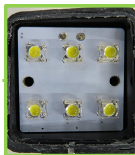
LEDバックランプ レンズカバー除去後(LED素子 計6点)