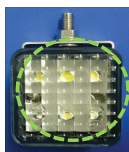
LEDバックランプ本体