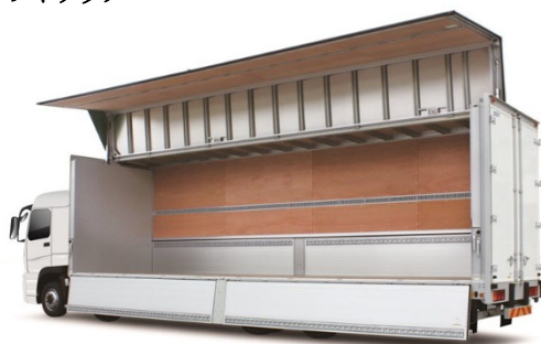
大型ウイングボデー