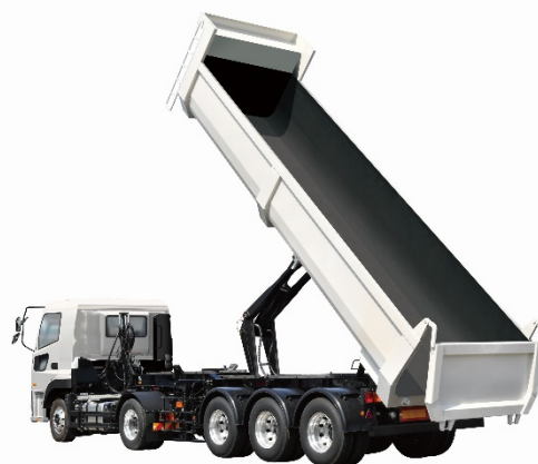
リヤダンプトレーラ