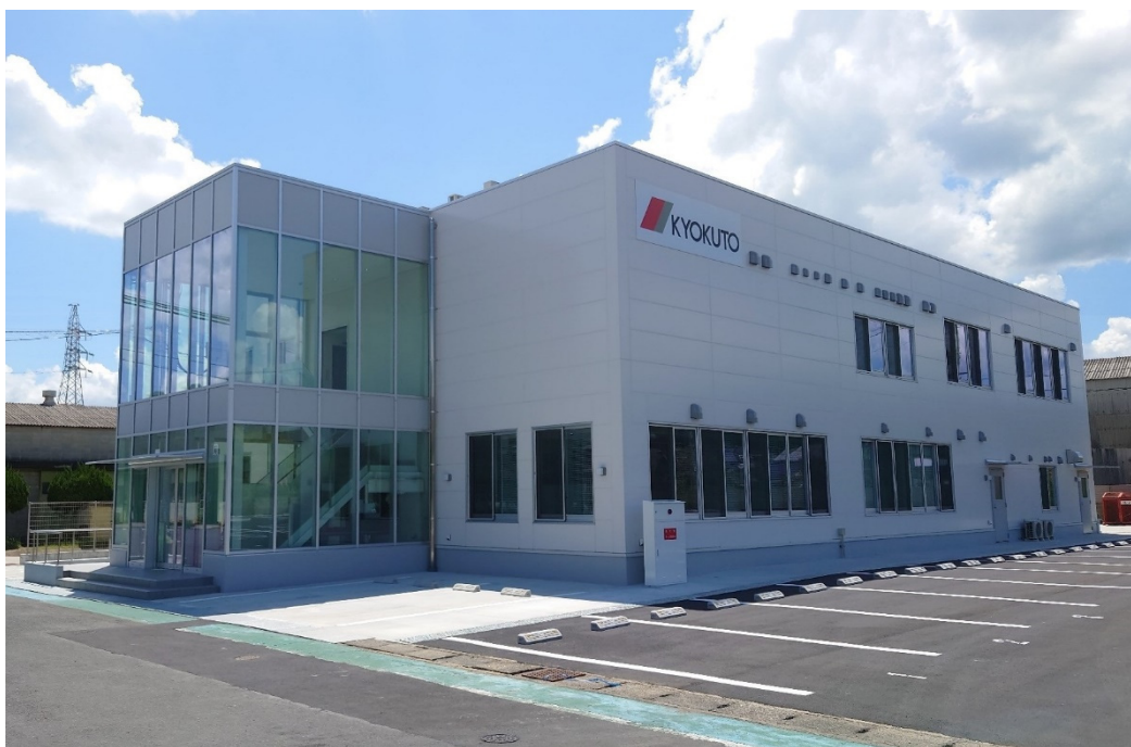
福岡工場 新事務所

さらに新工場棟及び新事務所それぞれの屋根上に当社の生産工場として初めて太陽光パネルを設置し、クリーンエネルギーの利用によるCO2排出量の削減をはじめとした環境への対応を図りました。本件に係る投資額は新工場棟・新事務所合計で約8億円です。