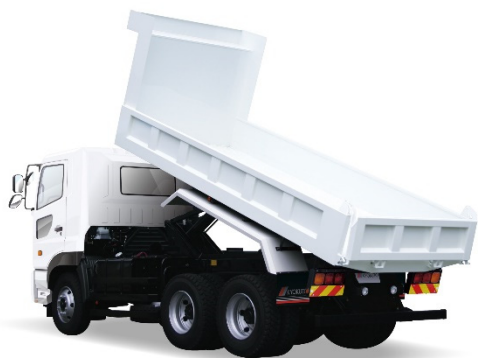
大型リヤダンプトラック