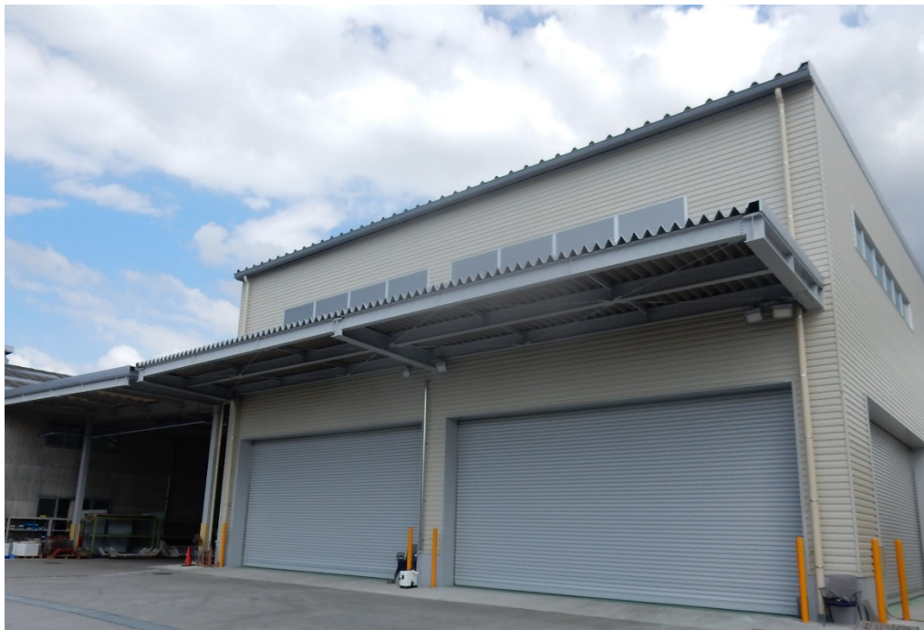
福岡工場 新工場棟(第二組立工場)

極東開発グループでは、本件をはじめとして、主力事業である特装車事業における生産性の向上に寄与する設備投資を積極的に進め、「はたらく自動車」の製造を通じ、今後とも国内外の社会インフラの構築・維持管理に貢献してまいります。