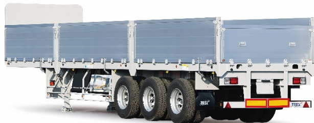
アオリ付セミトレーラ