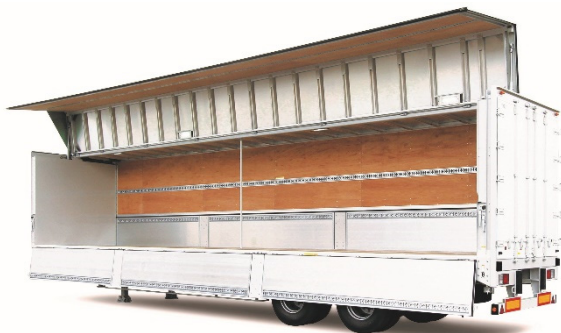
ウイングセミトレーラ