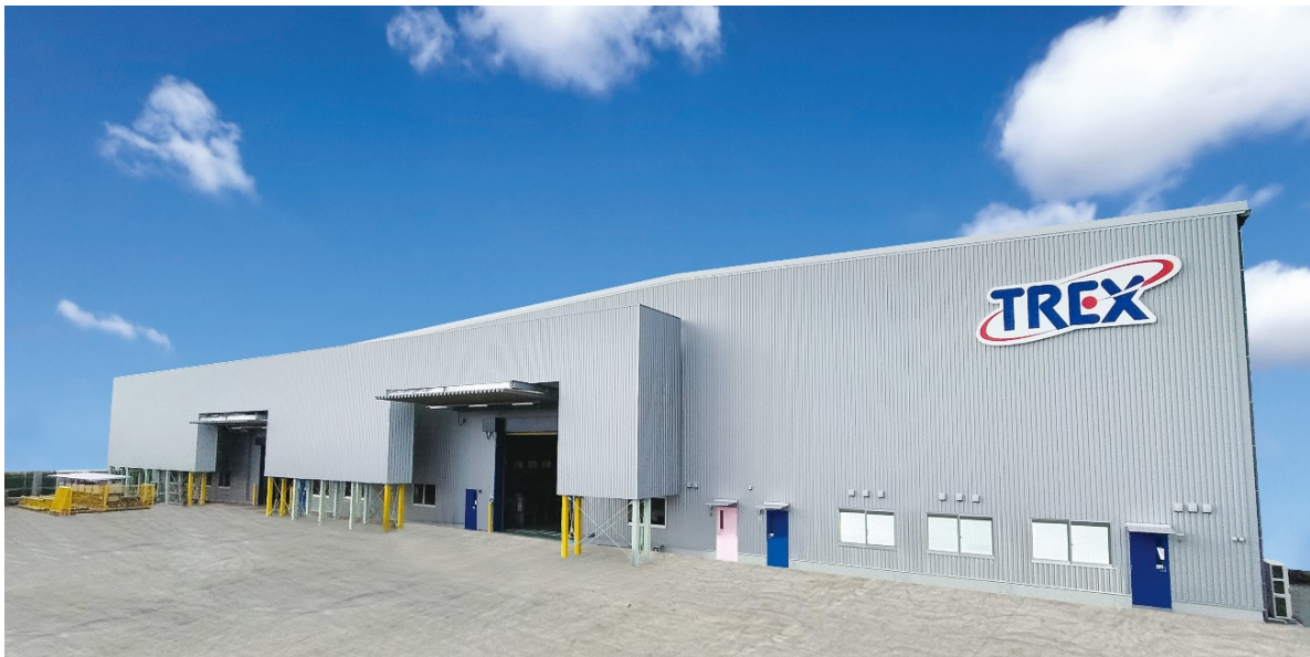
日本トレクス 本社 トレーラ生産工場(E工場)

さらに、本社事業所で使用する電力の10～15%を賄うことを可能とした太陽光発電システム(750kw)の屋上への設置や、NAS電池(ナトリウム・硫黄電池)蓄電システム(1,800kw)の設置により休日に太陽光を蓄電することで、再生可能エネルギーの活用を推進し、CO2排出量についても年間約3.2t(見込み)削減するなど、環境にも配慮した工場となります。