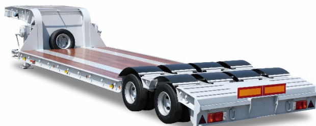
重機運搬用セミトレーラ

< 広報お問合せ先 > 極東開発工業株式会社 法務広報部 〒541-8519 大阪市中央区淡路町二丁目5番11号 電話 (06) 6205 - 7826 F A X (06) 6205 - 7830 ホームページアドレス https://www.kyokuto.com/