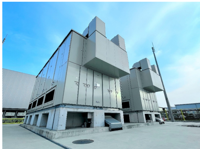
NAS 電池蓄電システム