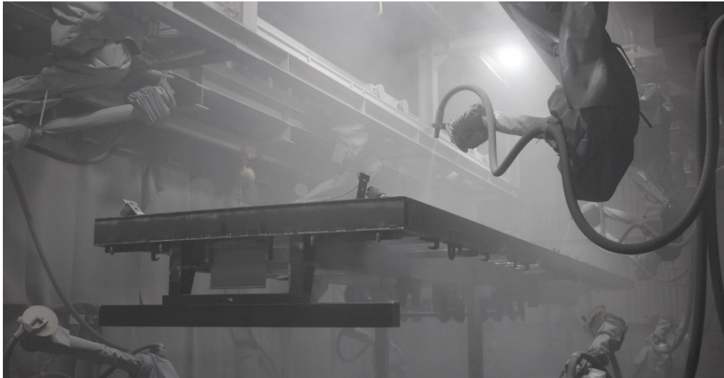
ショットブラスト(ロボット)