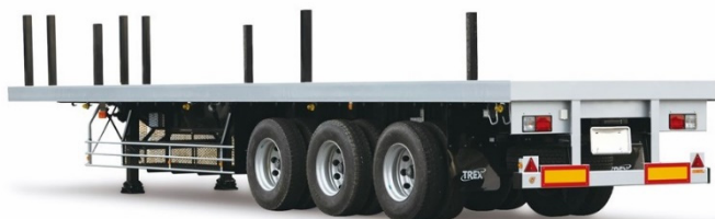
平床セミトレーラ