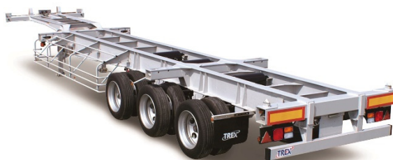
コンテナセミトレーラ