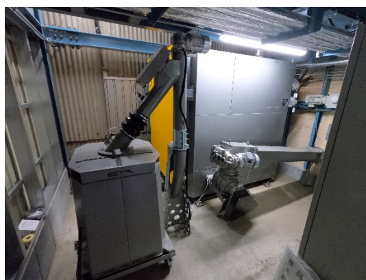
木質バイオマスボイラーユニット