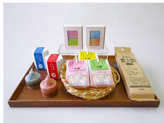
中外燐寸社様の製品

中外燐寸社様ウェブサイト： https://chugai-match.co.jp/